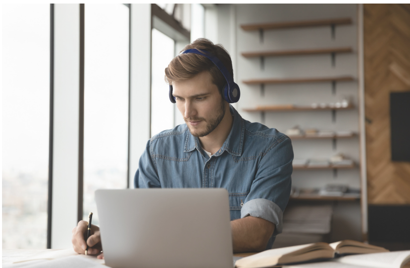
Tableau de bord Sécurité pour tous

Le Tableau de bord Sécurité pour tous est un outil disponible pour l'ensemble des employés du Mouvement Desjardins. Cette plateforme de sensibilisation regroupe notamment les formations obligatoires, les capsules de sensibilisation et les outils pertinents. Les gestionnaires peuvent également y suivre la posture de sécurité de chacun de leurs employés.